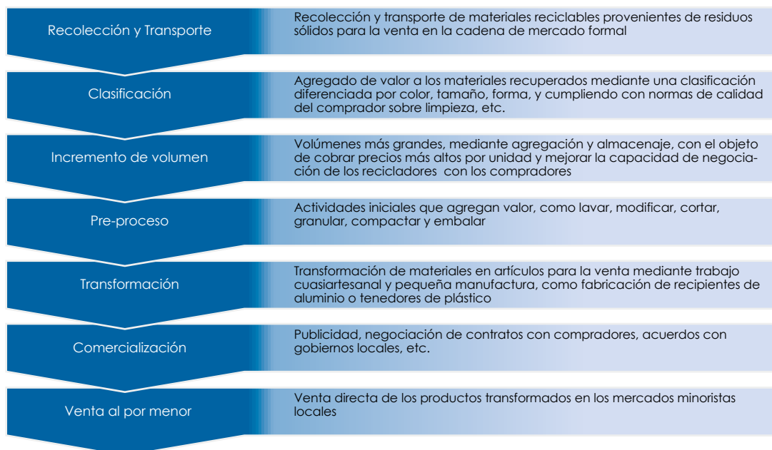
Gráfico 1. La cadena de reciclaje