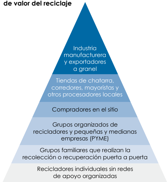
Gráfico 2. Actores en la cadena de valor del reciclaje